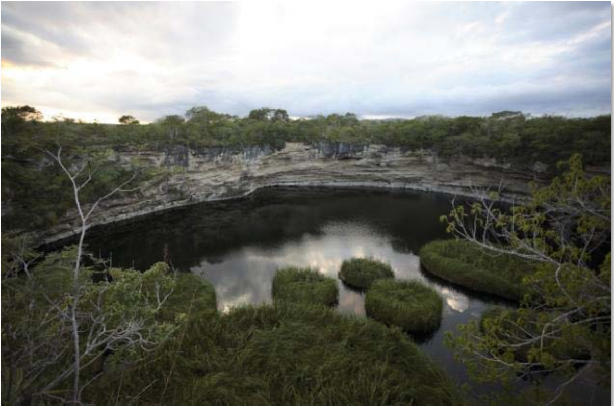
Le cenote de Zacaton est le plus profond connu à ce jour

«Le seul exploit qui me permet peut-être de m'identifier aux grands explorateurs est le fait que j'ai trouvé «mon Everest à moi », à Zacaton, que j'appelle souvent ma Maîtresse Fatale. Elle ne m'a permis de la pénétrer qu'à son bon vouloir ; d'autres fois, elle m'a refusé son intimité ; elle a été jusqu'à tuer mon maître et ami et m'a moi-même sérieusement menacé de mort en une occasion... Il n'y pas un jour où je ne pense pas à elle : comme Dante avec sa Béatrice, je suis perdu dans son charme... Zacaton m'obsède, mais que serait ma vie sans elle ?»